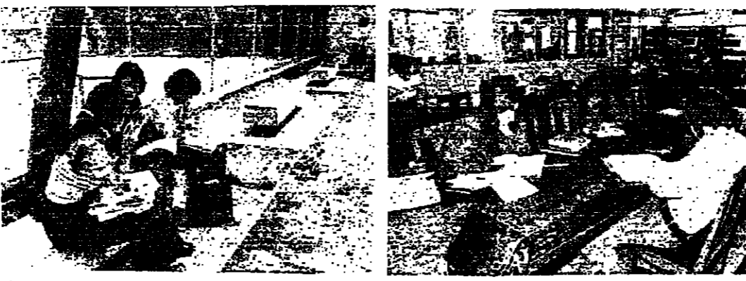
الاستعداد للاجتماعات في مكتبة الكلية

أول اهتمام بعمد التحرك ، يقول والده وزير التعليم العالي في الحكومة الأردنية ، وهو مسؤول في القوى العاملة الأردنية في كبرى الشركات العالمية . وقال : لقد كنت في كنفه منذ طفولتي ، وقد علمت منه الكثير ، ومنذ ذلك الحين ، وأنا أحرص على أن يكون هو الذي يربي أولادنا ، ولا يربوهم الآخرون .